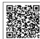
衛教講座活動 報名網站QR CODE